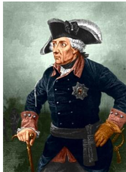
Frederik de Grote 1712-1786

bolwerk. Binnen de stad was een actief Karmelietessen klooster dat belangrijk was in de tegen-reformatorische beweging. Geldern was na Venlo en Roermond de derde stad van het Gelders Overkwartier. De vestingwerken moesten in de loop der eeuwen voortdurend worden onderhouden en uitgebreid. Hiervoor was veel mankracht nodig. Een deel der mankracht werd verkregen door het edict van Koning Frederik II van Pruisen uitgegeven op 4 januari 1744 waarbij de justitiemedewerkers werden verplicht landlopers op te pakken en levenslang op te sluiten op een vesting en om ze daar te laten werken. Ze mochten niet meer het land worden uitgezet, dus verkapte slavernij. Goedkope arbeidskrachten dus. Het was echter te weinig om alle werkzaamheden klaar te krijgen. Zo werden uit het Overkwartier van Gelder honderden arbeiders geworven (verplicht). Ze moesten worden aangewezen door de schepbank. En dus moesten inwoners van Baarlo naar Geldern gaan om te werken. Hiervoor ontving de schepbank opdracht om regelmatig voor 2 dagen arbeid twee karren en paarden en drie arbeiders te leveren. Ze moesten s, morgens vroeg aanwezig zijn en konden pas na de 2e dag huiswaarts keren, dus 2 volle dagen werken. Ze waren dus alles bij elkaar met heen en terugreis telkens 4 dagen van huis. Er zijn veel namen bekend van Baarlonaars die verplicht naar Geldern gingen werken aan de vestingwerken. Om u een inzicht te geven publiceren wij hierbij een