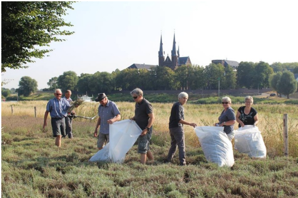
Vrijwilligers aan de slag met het oogsten van de lavendel

Het Nederlands Instituut voor Militaire Historie (NIMH) in Den Haag heeft historische luchtfoto's online gezet. Het betreft foto's uit de jaren 20 en 30 van Nederlandse steden en dorpen. De foto's zijn door de Luchtvaartafdeling der Koninklijke Landmacht genomen. In een van onze eerdere edities van Baarloos Verleden werd een foto van kasteel d'Erp en omgeving getoond. In deze uitgave tonen we de oude dorpskern van omstreeks 1923. Het is een echt kijkplaatje. Zo zien we aan de Hoogstraat nog de oude kapelanie die omstreeks 1838 werd gebouwd. Het patronaat was nog niet gebouwd en ter hoogte van het Antoniuskapelletje is nog duidelijk te zien dat dit op een driesprong van wegen stond. Ook achter de pastorie is nog duidelijk een oudbouw zichtbaar en eveneens de loopbrug tussen het klooster en de parochiekerk. Verder zien we ook nog aan de overzijde van de Maasstraat de oude meisjesschool St. Odilia. Let u ook op de brouwerij met schoorsteen op de Grotestraat en de fraaie windmolen op de Molenberg.