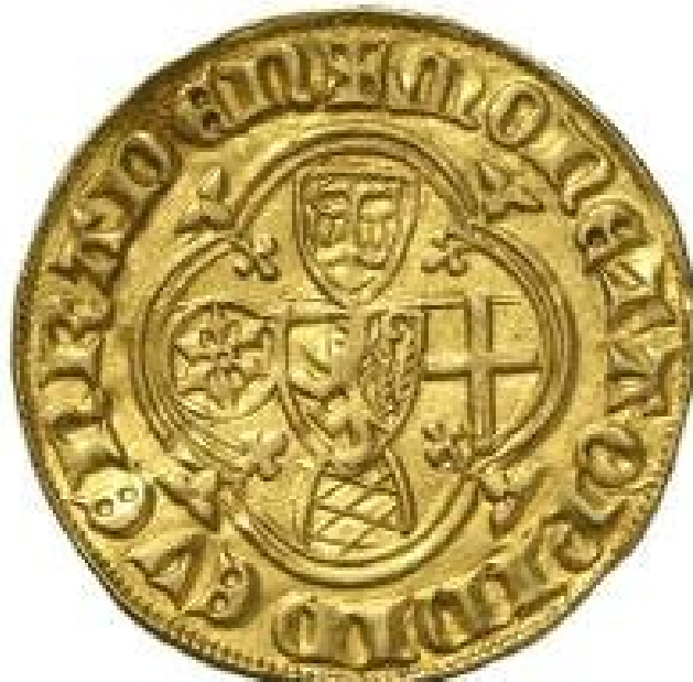
Gulden van Reinoud van Gulik als heer van het Land van Kessel (1394-1402)