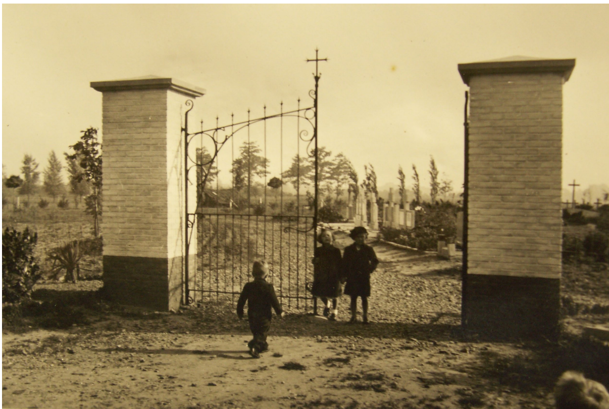
De Baarlose begraafplaats kort na de aanleg in 1950.