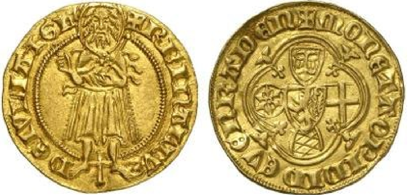
Gulden van Reinoud van Gulik als heer van het Land van Kessel (1394-1402)

11 oktober, 19:30 uur in de Engelbewaarder: